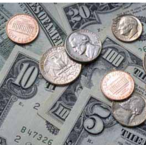
ЦБ РФ, Россия