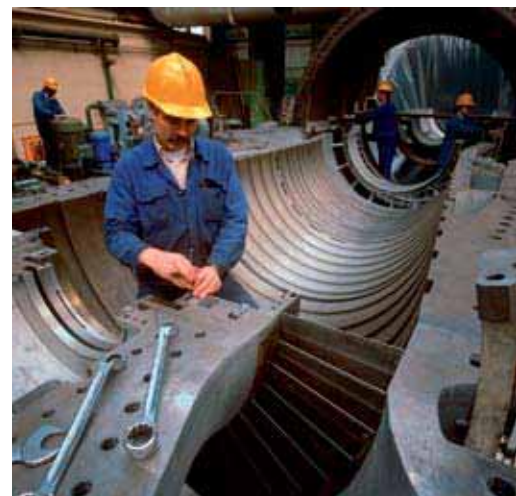
“Пермский моторный завод”, Россия

Серия Sunser - пропускная способность до 800 Нл/мин, давление до 8,5 бар