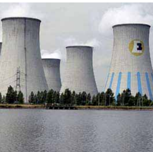
“ABB Alstom”, Чехия