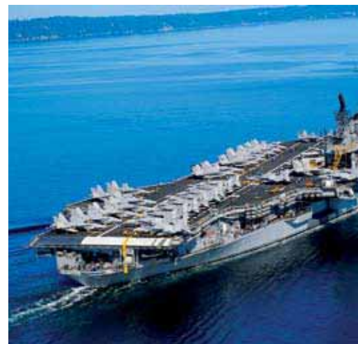
Авианесущий крейсер "Enterprise", ВМС США

Кроме того, мы занимаемся поставкой запасных частей и расходных материалов для компрессоров и вспомогательного оборудования некоторых других фирм-производителей.