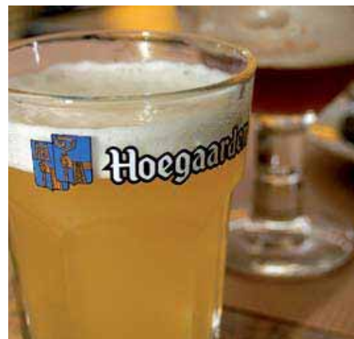
"САН" Интербрю, Бельгия, Россия