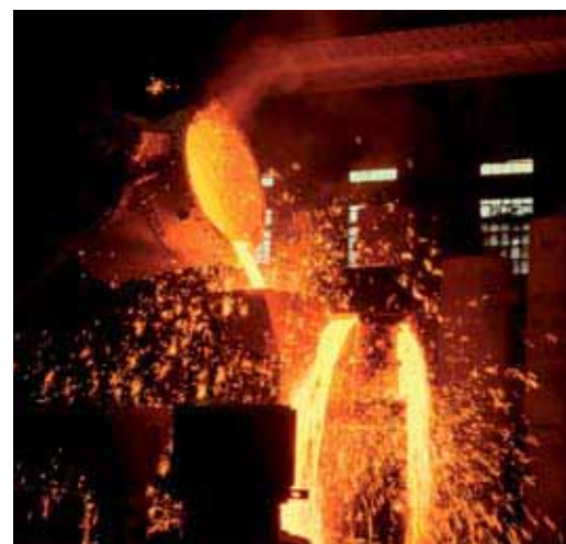
Группа компаний “РУСАЛ”, Россия