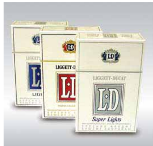
"Лиггет Дукад", Россия