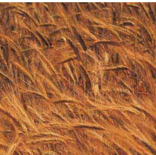
“Русский солод”, Россия