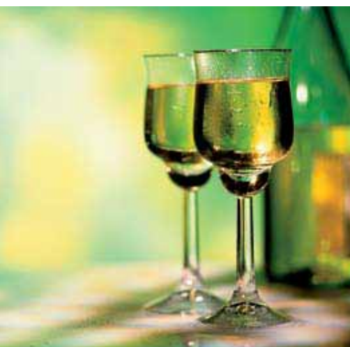
“Кристалл”, Россия, Беларусь